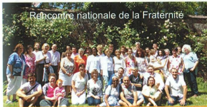
Rencontre nationale de la Fraternité

Dans cette spiritualité, est née la fraternité « La Résurrection de Lazare de Béthanie » en mars 2000. Elle compte aujourd'hui quelques 200 membres. Présents dans plusieurs pays, ses membres (clercs, laïcs, consacrés) témoignent de l'Amour du Christ qui transforme et renouvelle une vie.