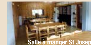
Salle à manger St Joseph

Parmi les réalisations : la salle à manger et les peintures des fenêtres des chambres de la maison saint Joseph, le démarrage de la rénovation des chambres communautaires. Nous vous remercions pour le soutien que vous nous avez apporté.